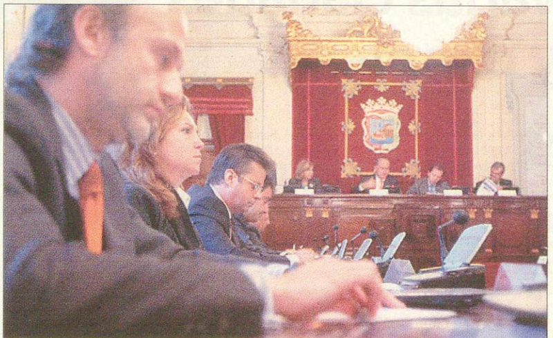
Un momento de la reunión en el salón de plenos del Ayuntamiento de Málaga.